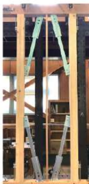
住友理工製制震システム 「TRCplus」